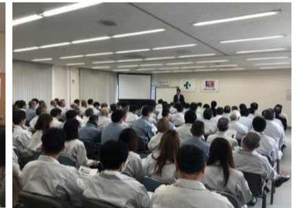
【コロナ禍前の令和2年1月の写真】