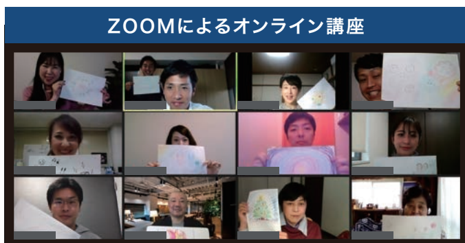
ZOOMによるオンライン講座