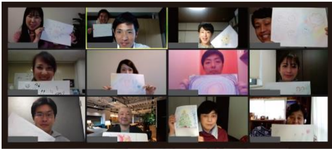
【↑ 20年度静岡クラスの様子】

3月6日(土)10時~、礎講師が直接講座の魅力についてお伝えするオンライン説明会を開催します。 全員の質問に丁寧に回答させて頂き、大変好評を頂いております。 ビデオオフでの参加もOKです。 是非お気軽にご参加ください! https://career-drive.education/campaign